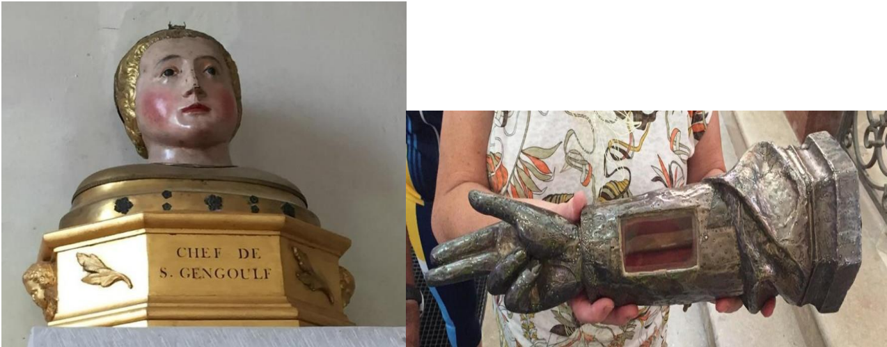
La tête et le bras de St Gengoux, église de Tart-le-Haut (21).

Saint Gengoux, seigneur de Bourgogne a vécu au VIII e siècle. Sa légende a donné lieu à au moins trois versions.